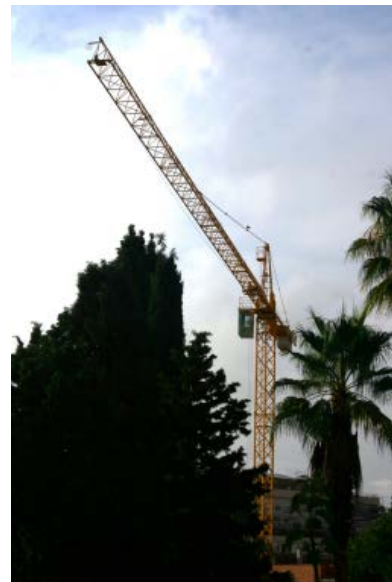
Intervenció en edifici i obra nova a la ciutat de Barcelona

contenir el dèficit es tornarà a sacrificar més construcció d'infraestructures, amb la qual cosa el 2017 només es pot esperar creixement de l'edificació, limitant la previsió al 3,2%.