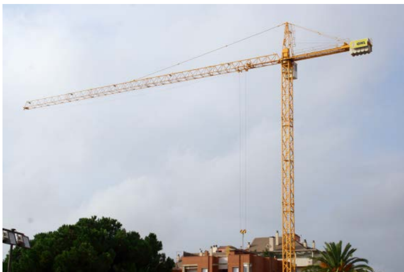
La recuperació de l'activitat és ben visible en alguns municipis

altres alternatives, de manera que la previsió es torna més conservadora: 6% el 2018, 5% el 2019.